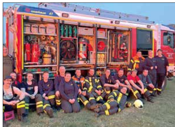
Feuerwehr Zwewendorf-Hohenthurm Reideburger Str. 5 in Zwewendorf

Dieses Mal zog es ihn also als Leiter der Neumayer-Station II von Ende des Jahres 2000 bis Anfang des Jahres 2002 in die Antarktis. Als Arzt war er auch für die medizinische Versorgung der Stationsbewohner verantwortlich. An Bord waren außerdem zwei Meteorologen, zwei Geophysiker, ein Ingenieur, ein Mechaniker, ein Funker und